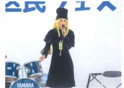
2018年にはプロのモノマネ芸人の方々にステージを盛り上げていただきました。