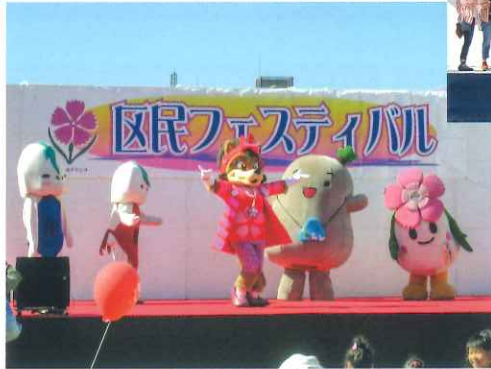
ご当地キャラクターが登場すると写真を撮る方がたくさんいらっしゃいました。