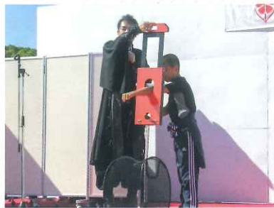
マジックでは会場中が驚かされました。