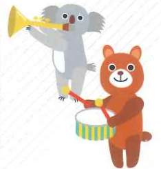
フェスティバルの締めはやっぱり“民謡総おどり”