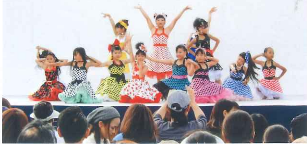
子ども達も日頃の練習の成果を思う存分披露してくれました。