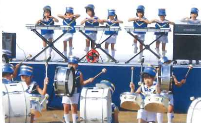
元気で明るい子ども達の演奏では、場内に活気があふれ、笑顔がたくさん見受けられました。