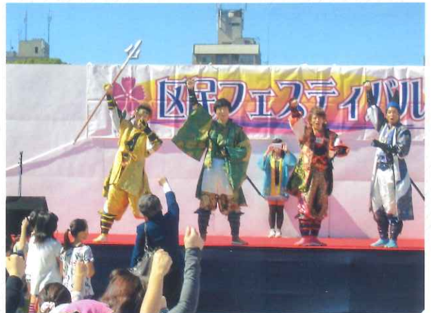
様々な催しが実施され、会場一体となって区民フェスティバルが盛り上がりました。